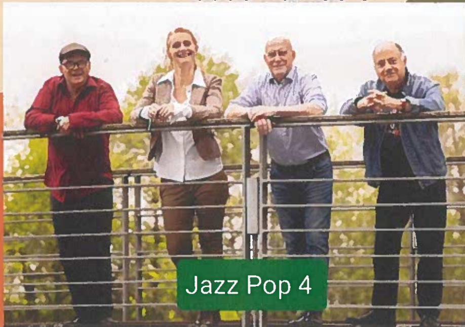
Jazz Pop 4

Folkehuset Marselis, Marselis Boulevard 94A, 8000 Aarhus C