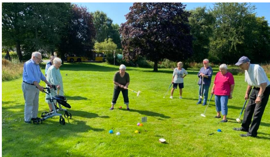
Billede af krolfspillere taget torsdag d. 18. august