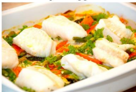
Fisk i fad med porrer og gulerødder