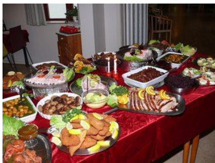
Caféens lækre julefrokost